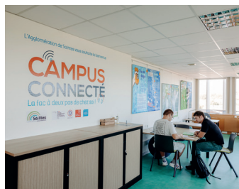
Un grand espace de travail et d'étude

Vous bénéficiez d'un accompagnement personnalisé ainsi que d'ateliers ponctuels avec des professionnels. De nombreuses formations qualifiantes dans des champs disciplinaires variés seront accessibles.