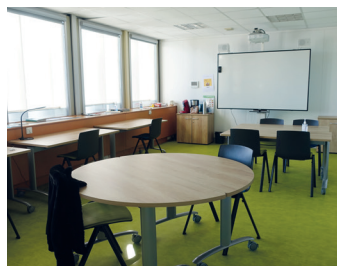
Des espaces de travail collaboratif