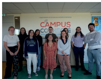
Des moments d'échange entre étudiants